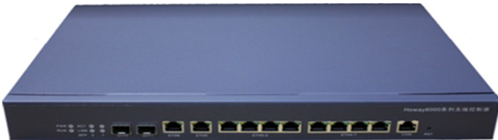
(图一)Howay AC-256 无线控制器

Howay AC-256 系列无线局域网控制器（图一），提供 8 个可供电千兆以太网口、2 个千兆以太网口、2 个千兆光口，最大可管理 256 台 AP,不支持扩展。